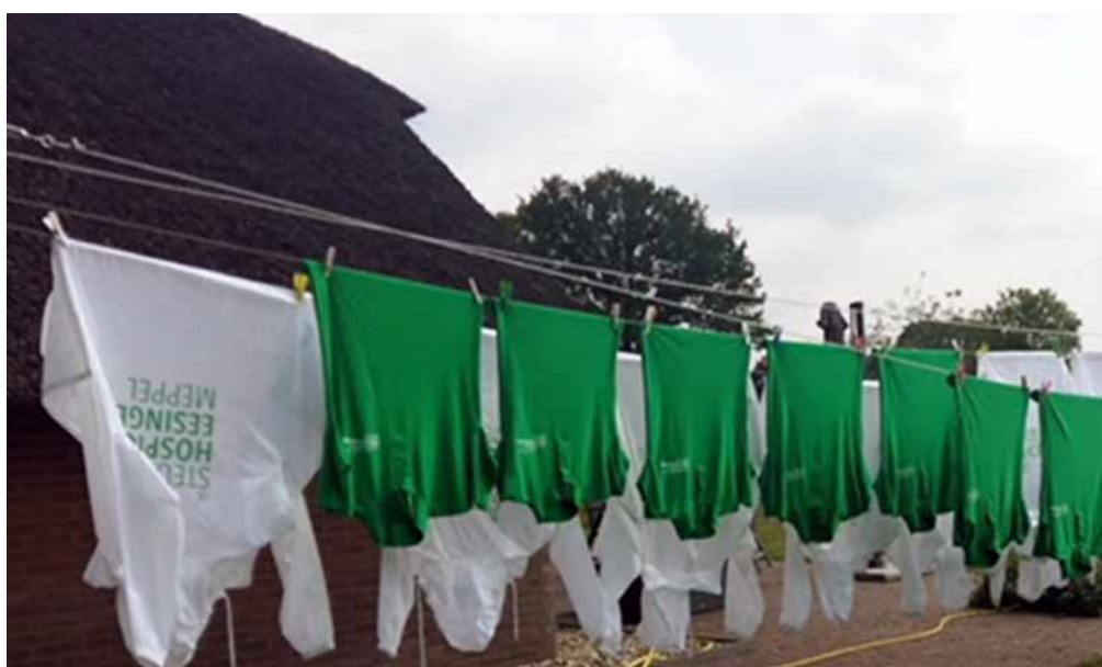
De shirts en jasjes hangen te drogen bij het hospice -na een zeer geslaagde Samenloop voor Hoop- voor een volgend evenement.